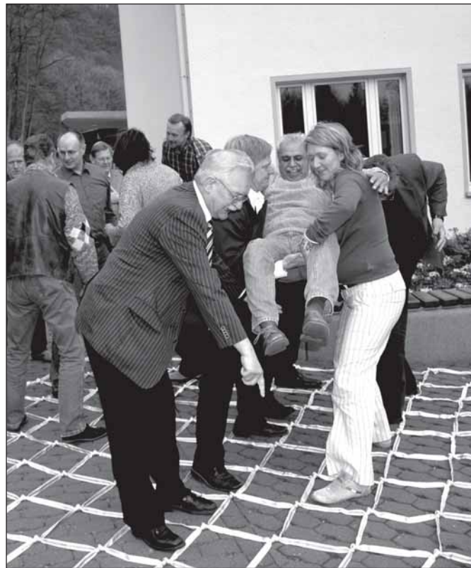
Kooperative Übungen außen