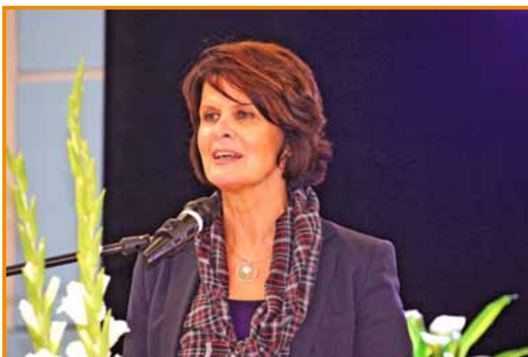
Ministerin Reiß: Eltern kennen ihre Kinder am besten

Im Forum Gymnasien wurden die Elternrechte in Theorie und Praxis in den Mittelpunkt gestellt. In dem vollbesetzten Klassenraum mussten zusätzliche Stühle „beschafft“ werden, um noch einigen Teilnehmerinnen und Teilnehmern die Anwesenheit zu ermöglichen. Die LEB-Vorstandsmitglieder Werner Dörr und Hansjürgen Bauer erläuterten anhand eines powerpoint-Vortrags ausgewählte Problemkomplexe, die vor allem in Gymnasien Klassenelternvertreter/innen und/oder Schulelternbeiräte beschäftigen. Ein besonderer Schwerpunkt wurde auf die Neuerungen des Schulgesetzes 2014 gelegt. In der Diskussion wurden u.a. die Wahlvorschriften für die zusätzlichen Elternvertreterinnen und Elternvertreter für die Gesamtkonferenz detailliert hinterfragt. Auch wurde deutlich, dass es nach wie vor an manchen Gymnasien nicht üblich ist, Elternvertreter/innen zu allen Konferenzen, die nicht Notenkonferenzen sind, einzuladen. Hier gilt es für den LEB, in der Aufklärungsarbeit nicht nachzulassen: Obgleich LEB wie Regionalelternbeiräte seit Jahren kritisieren, dass die Schulleitungen diese Gesetzes-