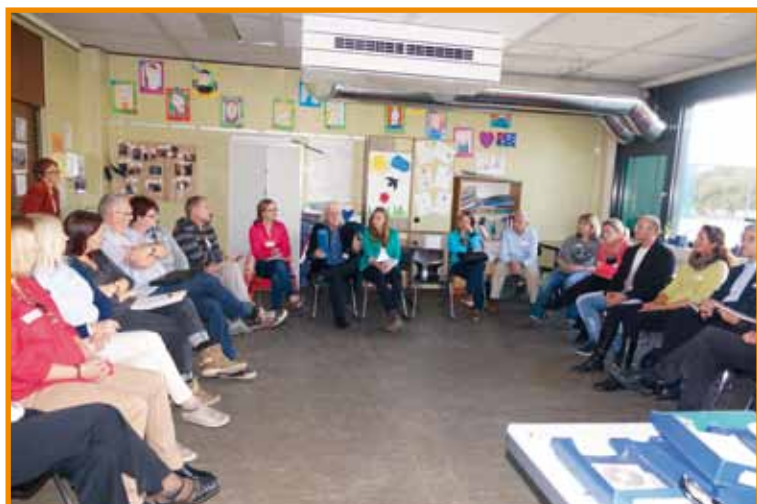
Frage nach dem besten Förderort in Forum 5 am drängendsten