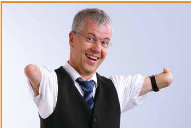
... und im nächsten Moment alle zum Lachen bringen.

„Was können wir tun, damit Sie bei uns Abitur machen können?“, fragt ihn der Schulleiter, als er nach der 10. Klasse in die Oberstufe eines Gymnasiums wechselt. Nicht immer spielt sich Inklusion in der Schule so reibungslos ab. Die deutsche Schule sei eine „Wettkampfschule“, in der die Schülerinnen und Schüler anhand der Noten ständig miteinander verglichen würden. Gleiche Aufgaben und Ziele für alle seien eben weder gerecht noch inklusiv. „Inklusion“, definierte Schmidt, „bedeutet, dass sehr verschiedene Menschen zusammen lernen und leben und dass es ihnen dabei gut geht.“