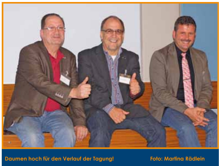
Daumen hoch für den Verlauf der Tagung!

Identität nennt man Coming out. Die Signale der heteronormativen Umwelt, dass eine heterosexuelle Entwicklung erwartet wird, verursachen Stress, der sich ausdrücken kann in Leistungsabfall, Lernproblemen, Verhaltensstörungen, Depressionen oder einer höheren Anfälligkeit für Alkohol- und Drogenmissbrauch. LSBTI-Jugendliche haben ein 4-7-mal höheres Suizidrisiko als heterosexuelle. Anhand einer Fragebogen-Übung stellten die Workshop-Teilnehmer Erfahrungen von heterosexuellen Jugendlichen einerseits und LSBTI-Jugendlichen andererseits gegenüber. Abschließend wurden konkrete Handlungsmöglichkeiten gegen Homophobie in Schule und Unterricht vorgestellt (u.a. einschreiten, wenn „schwul“ oder „lesbisch“ als Schimpfwort gebraucht wird, Mobbing unterbinden). Heterosexualität sollte nicht als Norm verstanden werden und im Umgang miteinander sollte nicht davon ausgegangen werden, dass das Gegenüber heterosexuell ist. (vgl. www.queernet-rlp.de )