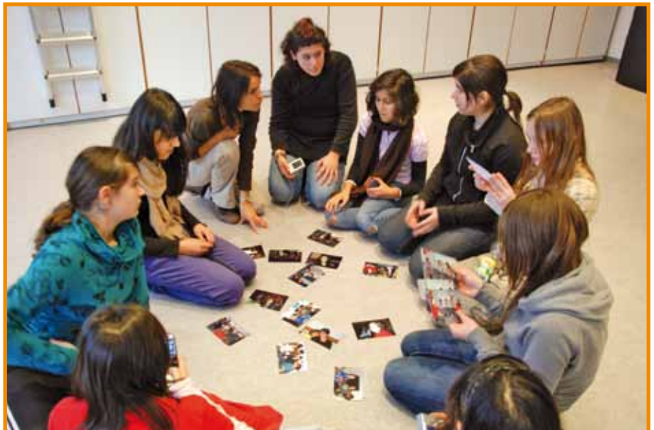
Im kleinen Kreis kommt jede zu Wort