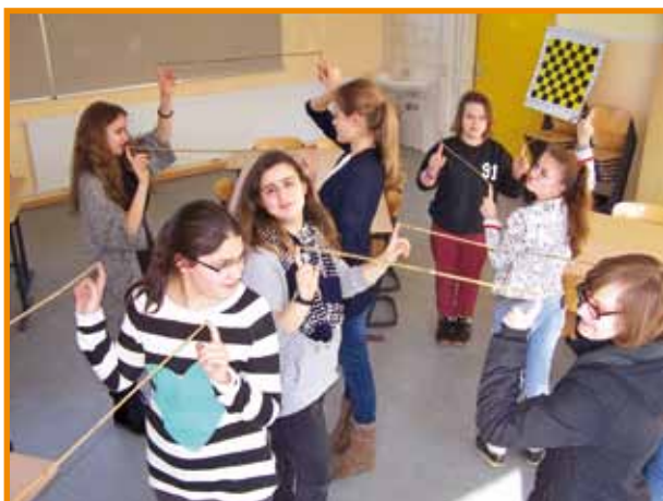
Im Umgang miteinander ist viel Fingerspitzengefühl gefragt

Berufseinstiegsbegleitung ist die einzel-fallbezogene Begleitung von Jugendlichen mit Problemen beim Schulabschluss und beim Übergang in eine berufliche Ausbildung (allgemeine Schulen und Schulen mit dem Förderschwerpunkt Lernen) während der allgemeinbildenden Schulzeit mit Fortführung ab Ausbildungsaufnahme für die Dauer von max. 6 / 12 Monate ( http://berufsorientierung.sonderpaedagogik.bildung-rp.de/uebergangschule-beruf/massnahmen-uebersicht/berufseinstiegsbegleitung-bereb.html )