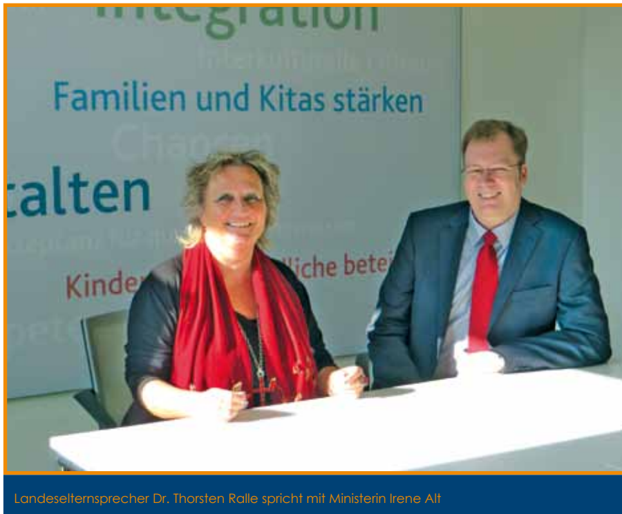
Landeselternsprecher Dr. Thorsten Ralle spricht mit Ministerin Irene Alt

kräften andererseits – verstanden, durch die sozialpädagogisches Handeln am Ort der Schule sowie im Umfeld der Schule ermöglicht wird. Schulsozialarbeit bringt jugendspezifische Ziele, Tätigkeitsformen, Methoden und Herangehensweisen in die Schule ein, die auch bei einer Erweiterung des beruflichen Auftrages der Lehrerinnen und Lehrer nicht durch die Schule allein realisiert werden können. Schulsozialarbeit ist also eine zusätzliche pädagogische