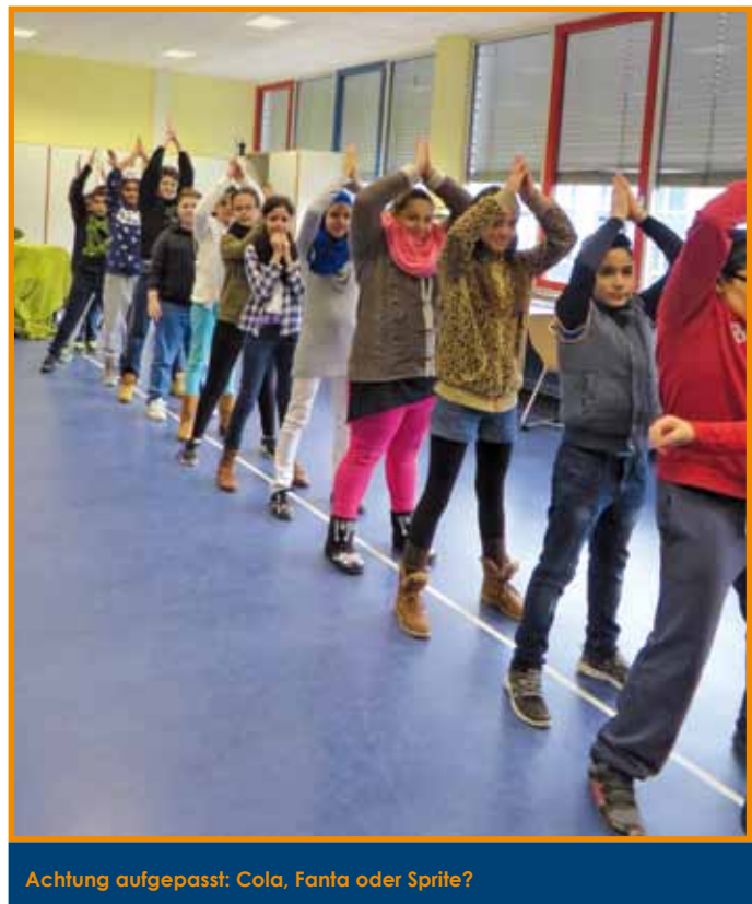
Achtung aufgepasst: Cola, Fanta oder Sprite?