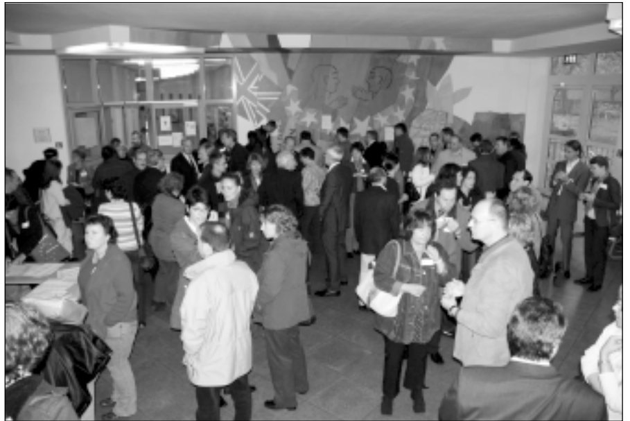
Eltern im Gespräch vor der Veranstaltung