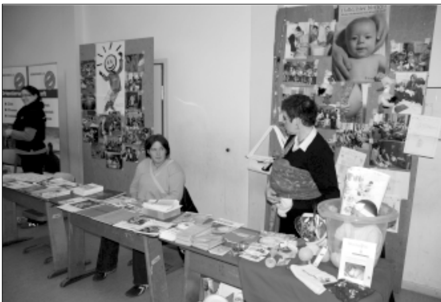
Informationsstände luden ein zur Information über die Arbeit des Landeselternbeirats, der Regionalelternbeiräte und ihrer Partner, hier: der Stand des Hebammenverbandes Rheinland-Pfalz

Insgesamt war die Kritik am neuen Konzept des Bildungsministeriums moderat. Niemand befürchtet, dass die Neuorganisation den Hauptschülern schadet, schon gar nicht die Eltern oder Lehrkräfte von Hauptschulen. Sie hatten vielfach schon im Vorfeld die Abschaffung dieser Schulart gefordert. Aus dem Bereich der Realschule kommen Einwände und Sorgen über möglichen Niveauverlust durch die Aufnahme von Hauptschülern. Aber schon nach der gemeinsamen Orientierungsstufe hat man ab der 7. Klasse die Möglichkeit der getrennten Bildungsgänge in der kooperativen Realschule. Und immerhin wurde mit der Fachhochschulreife an der Realschule plus eine langjährige Forderung des Realschullehrerverbandes erfüllt. Die eifrigsten Verfechter der Hauptschule fand man schon lange im Philologenverband. Auch wenn die Gymnasien durch den Reformvorschlag völlig „verschont“ wurden, fühlen sie sich durch ihn bedroht: So befürchten manche (Gymnasial-) Eltern und Lehrkräfte einen zusätzlichen Run auf diese Schulform, die schon jetzt aus allen Nähten platzt. Ob die Möglichkeit zur Fachhochschulreife und eine innovative, leistungsorientierte Pädagogik die Realschule