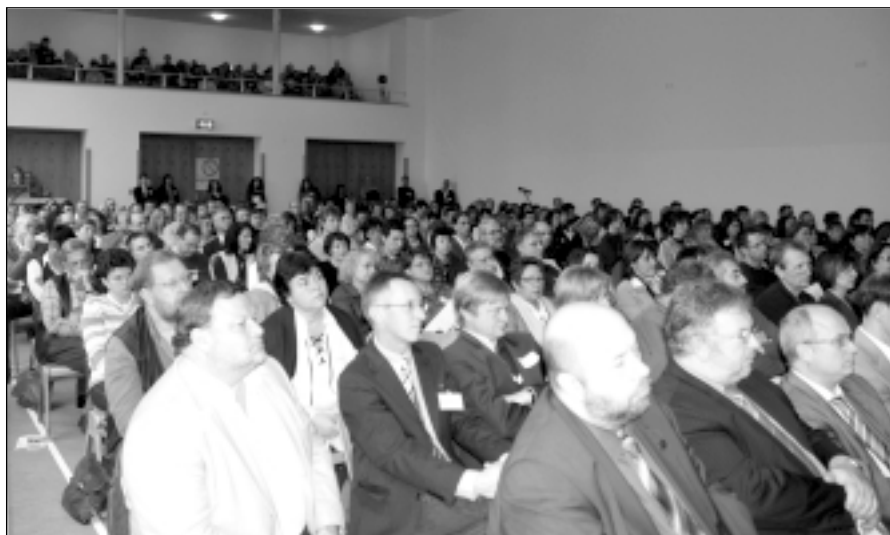
Fast 300 Eltern und Gäste nahmen am Landeselternntag in Trier teil

Schüler beurteilt. Ihr Gehalt enthält leistungsabhängige Komponenten.