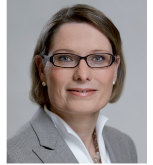
Dr. Stefanie Hubig وزارة التعليم